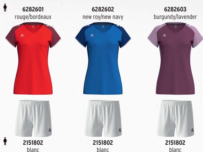
6282601 rouge/bordeaux 2151802 blanc 6282602 new roy/new navy 2151802 blanc 6282603 burgundy/lavender 2151802 blanc