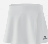
2412302 new white