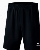
2152102 809210 noir