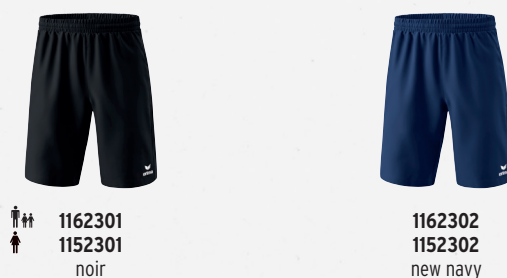
1162301 1152301 noir 1162302 1152302 new navy 1162303 1152303 slate grey