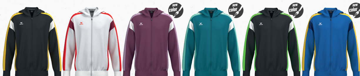
1032582 1032590 noir/jaune 1032583 1032585 blanc/rouge 1032630 1032619 burgund/lavender 1032631 1032620 tahitian blue/mint 1032632 1032621 noir/green gecko 1032644 1032640 new roy/jaune