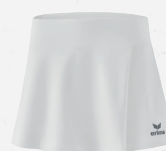
2412302 new white