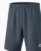
2152103 - slate grey