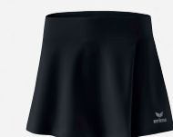
♂♂ 2412301 noir