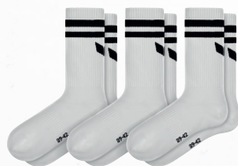
2182610 new white

T. 31-34, 35-38, 39-42, 43-46, 47-50 EUR 10,00*