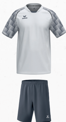
2152103 slate grey