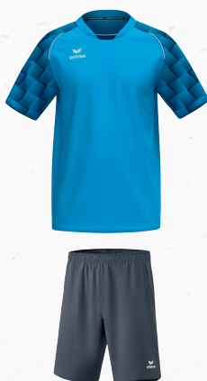
2152103 slate grey