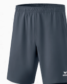
2152103 - slate grey