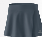
2412303 slate grey