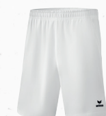
♂♂ 2152101 ♀ 2151802 blanc