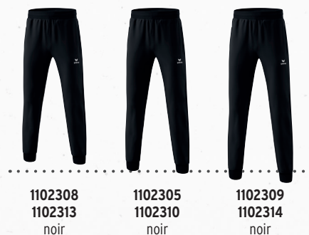
1102308 1102313 noir 1102305 1102310 noir 1102309 1102314 noir