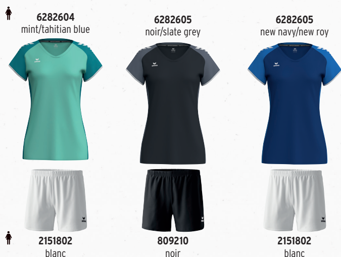
6282604 mint/tahitian blue 2151802 blanc 6282605 noir/slate grey 809210 noir 6282605 new navy/new roy 2151802 blanc