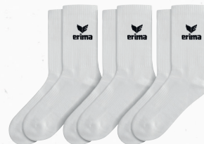
2182505 new white