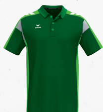
1112503 émeraude/green gecko