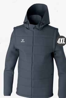
2062404 slate grey