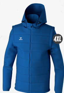
2062402 new royal