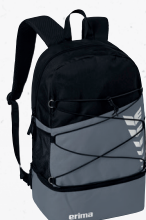
7232317 slate grey/noir