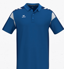
1112502 new roy/new navy