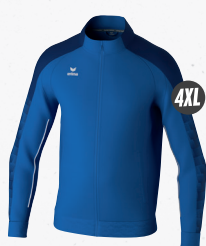
1032413 new roy/new navy