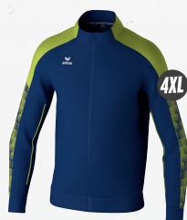
1032420 new navy/lime