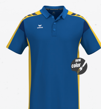
1112601 new roy/jaune