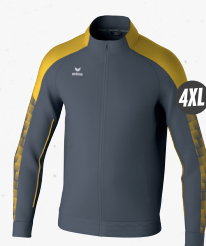
1032416 slate grey/jaune