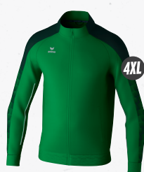
1032414 émeraude/pine grove