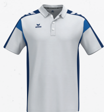
1112509 blanc/new navy