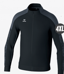
1032456 noir/slate grey