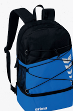
7232318 new roy/noir