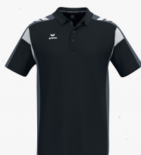
1112504 noir/slate grey