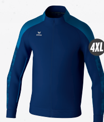
1032422 new navy/mykonos blue