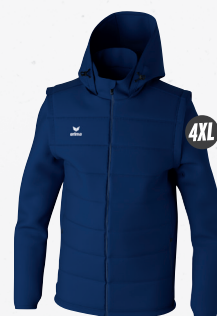
2062405 new navy