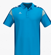
1112506 curaçao/new royal