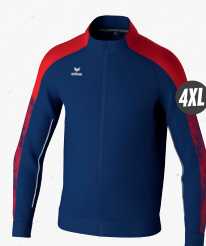
1032415 new navy/rouge